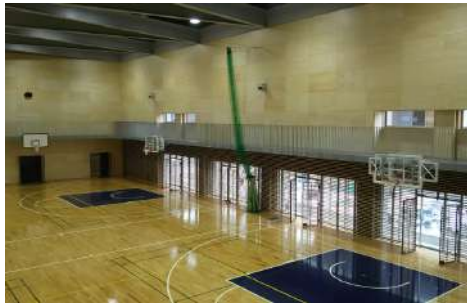
南山高等・中学校 男子部