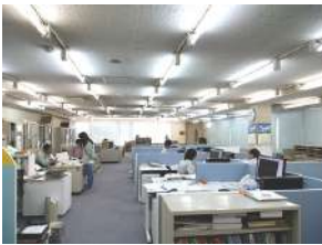
設計施工管理部門