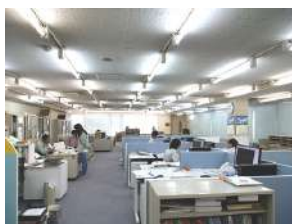
設計施工管理部門