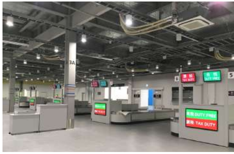
中部国際空港第二ターミナル