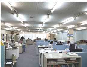
設計施工管理部門